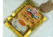
Mephedrone (喵喵) bk MDMA、MDPV (浴鹽) 等安非他命類毒品