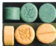
MDMA、MDA、PMMA 等安非他命類毒品