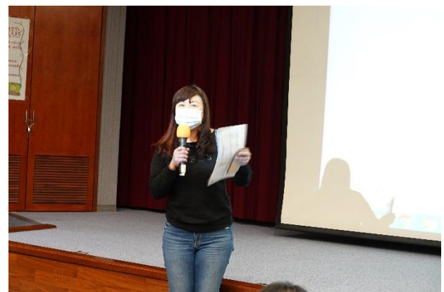
師培處報告相關事項