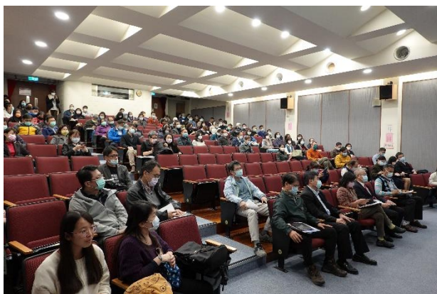
師長們參與研討會的情形