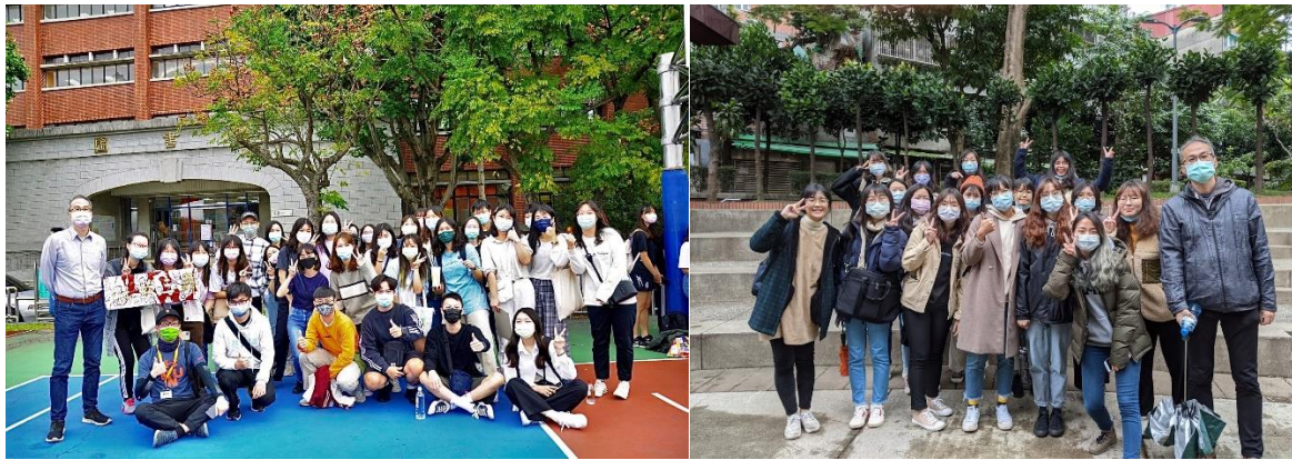
圖七 運動會及同學

為減少 COVID19 下之互動影響，我利用運動會及當天聚餐方式，以及課程內的校外教學，讓同學進一步聚會及分享彼此狀況。