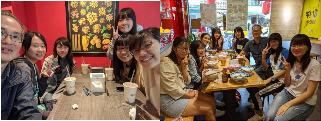
圖二 分組聚餐照片

最後，大一階段，我也利用必修課的時間，辦理校外教學活動，帶領大一同學，參訪台北市的大龍峒地區，導覽大同區一帶的歷史文化資產及相關文化空間，同時，也讓大一新生瞭解未來社發系專業發展方向，進一步凝聚學生之認同感。