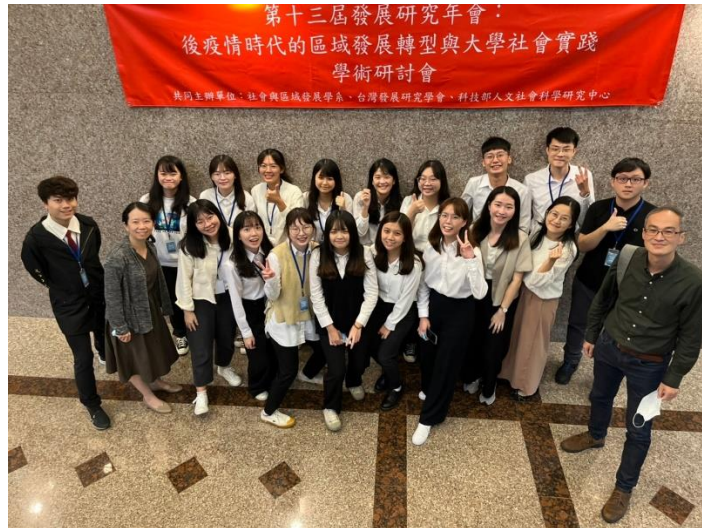
圖六 舉辦本系專業研討會

為減少 COVID19 下之互動影響，我利用運動會及當天聚餐方式，以及課程內的校外教學，讓同學進一步聚會及分享彼此狀況。