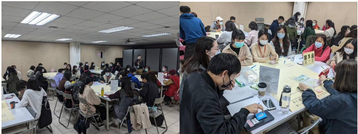
圖五 學生大安區參與式預算之實際場景

由於學生因為個別生涯及修課時間不一，難有固定互動時間，進行導生互動。除了持續分組聚餐外，我也積極利用課程，鼓勵學生參與大安區參與式預算，利用學生參與社區，以累積實務經驗與社區民眾互動。