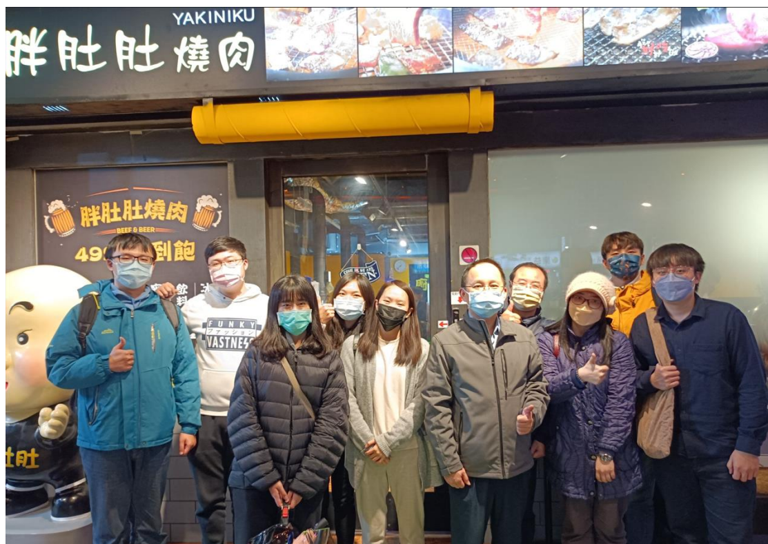
圖 1 請班上同學一起到燒烤店餐敘 (有排煙換氣設備能降低染疫風險)

當導師不是一件容易的工作，但卻一件重要的工作。碩士班導師與指導教授的角色任務也不完全相同，都是讓學生有多個可以諮詢協助的對象，也希望學生可以善用資源，幫助自己能夠順利的畢業，往下一個目標前進。