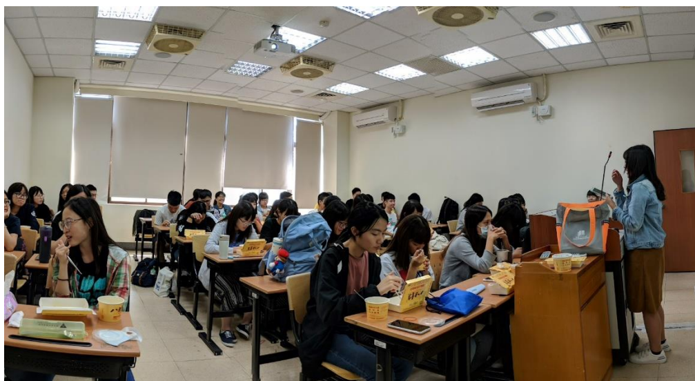
圖一 大一開班會場景

大學新生剛進入到本校，最大的疑問及期待，就是系上專業及未來生涯方向。為了增進學生的認同及熟悉校園環境，我一開始是藉由擔任職涯導師之身分，針對大一新生辦理 UCAN 施測，過程中，我請每位學生填寫作業單之方式，藉以瞭解每位學生之主要興趣及對於未來學習之初步想像。